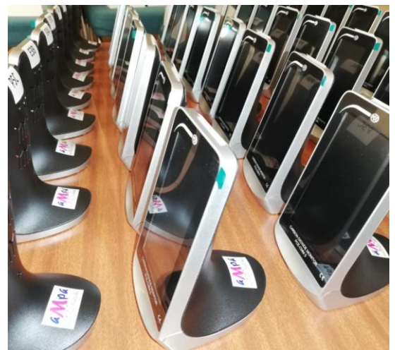
Imágenes de los 46 medidores de CO2 adquiridos para las aulas del colegio.